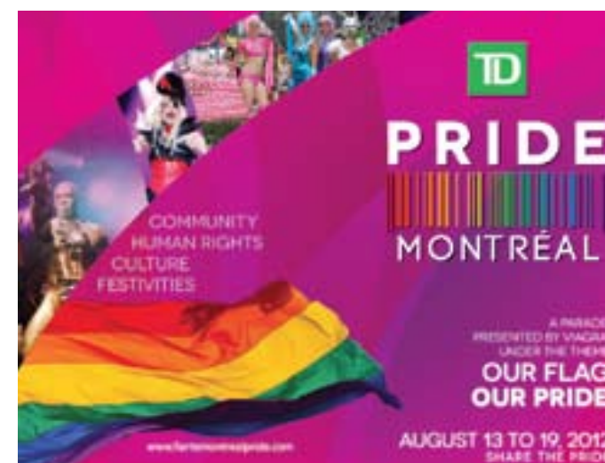
PANNEAU POUR L'ESPACE DJ (2)