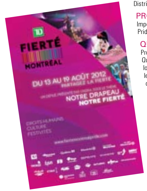
CARTES POSTALES (3 000 FR) – (3 000 EN)