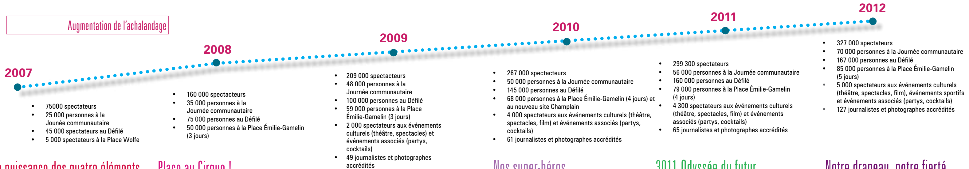
La puissance des quatre éléments The Power of the Four Elements